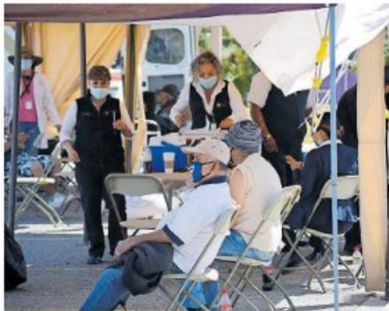
En Tijuana, el porcentaje de adultos mayores que no quieren la vacuna es el más alto en BC, mientras que en Mexicali fue del 25% y 25% en el resto de los municipios.

SE ANALIZA LA posibilidad de vacunación para la población entre los 50 y 59 años de edad, indicó la Secretaría de Salud del estado