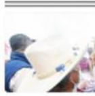
TIJUANA. La candidata reforzó los trabajos comunitarios de apoyo para adquirir mascarillas, gel y otros insumos de EE.

ARRANCA PLAN DE VACUNACIÓN SEGUIRÁ SEMÁFORO EN AMARILLO POR COVID-19 TIJUANA. Al iniciar el semana Baja California comenzó su "semáforo" en el semáforo epidemiológico. El secretario de Salud Secretaría de Salud del Estado, anunció que esta