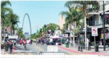
TIJUANA. El comercio se volvió optimista al registrar de 20 mil visitantes y derrama económica de un millón 700 mil dólares durante el periodo de la Semana Santa en esta ciudad.

A eso se suma una derrama económica de 1.7 millones de dólares; representa "un respiro", dicen